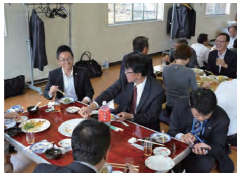
地元の味に舌鼓 お箸が止まらず会話ははずみました