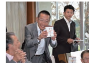
倶楽部からの賞を いただきましたニイスマイル