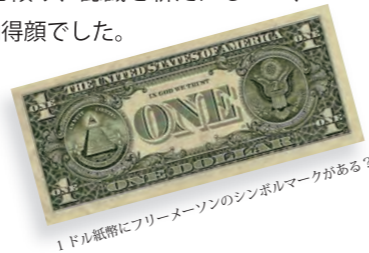
1ドル紙幣にフリーメイソンのシンボルマークがある？

お話を伺うほどに、何となくと幾多の本にも記されていない裏話続出、全員熱心に耳を傾け、認識を新たにしつつ、久し振りの歴史の勉強に納得顔でした。