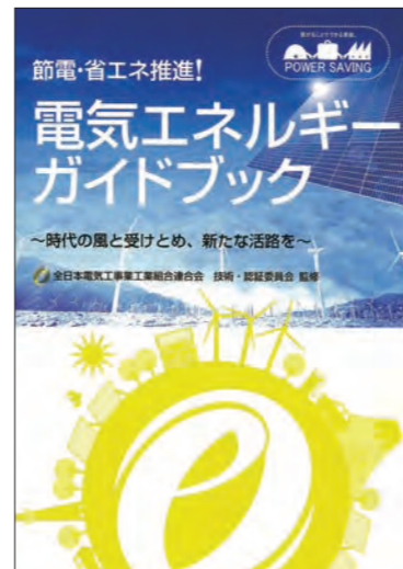
(A4サイズ 2色刷 全109ページ) 特別価格 800円/冊