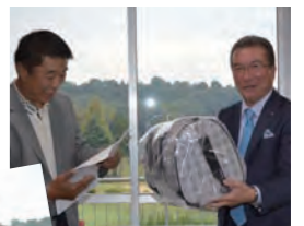
理事長も当月賞獲得