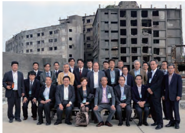
ガイドの話に心打たれてか、集合写真の表情はみなさん少し固め

しかし、エネルギー政策の変換により1974年閉山。炭鉱しかない島は無人の廃墟となり、“日本の粗大ゴミ”となったのです。故郷を追われた元島民ガイドによる熱のこもったお話を深く心に刻み、島を後にしました。