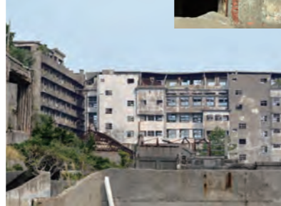
7階建て校舎（エレベーターナシ！）最上階は崩壊寸前