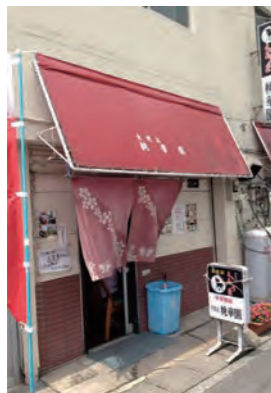
昼食会場「桃華園」シブい！

そしていよいよ上陸。そこは…「時が止まった」空間。石炭採掘のためだけに存在した、周囲わずか1.2kmの島。採掘規模の拡大に比例して人口は増え、狭い島には日本初の鉄筋コンクリート造りの高層集合住宅や娯楽施設、7階建ての校舎や病院など、生活に必要な施設が密集して建築されました。 台風が来れば波にのまれ、死と隣り合わせの採掘作業で真っ黒になった体を塩風呂で流し…という過酷な生活にも関わらず、最盛期には、約5,300人が暮らし、世界一の人口密度を誇ったといわれます。