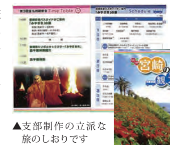
▲支部制作の立派な旅のしおりです

第2部は賛助会員さんも加わっての記念講演。宮交ホールディングス様より『宮崎の観光』についての講演と思いきや、なんと宮崎交通のバスガイドさん3名が制服姿で登場。DVDを使って、宮崎支部が特別に制作したオリジナルのしおりに沿い、県南、県央県西、県北の人気スポットを3日間にわたって模擬案内してくれました。昭和30年代から40年代にかけては、「新婚旅行と言えば宮崎」と言われる程賑わったのですが、今では海外に奪われ、客足の取り戻しに躍起だと伺いました。