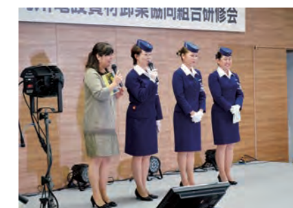
▲宮崎交通のガイドさん3名による、3日間の贅沢な宮崎観光を堪能。実はガイドさん、バスの中での案内はベテランながら、110名もの大人数を前にお話するのは初めての経験。声も足も震えて、とても緊張したとか。