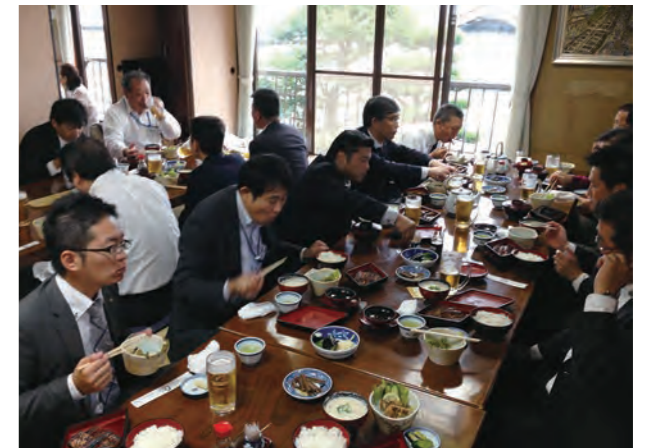
▲待合の別棟まである、宮崎の超人気店。この日もお客さんでいっぱい。順番が来ると、町内放送ばりのアナウンスで呼び出しされます。

歴史を感じる2階のお座敷で、ボリュームたっぷりのうなぎ三昧を心ゆくまで堪能しました。