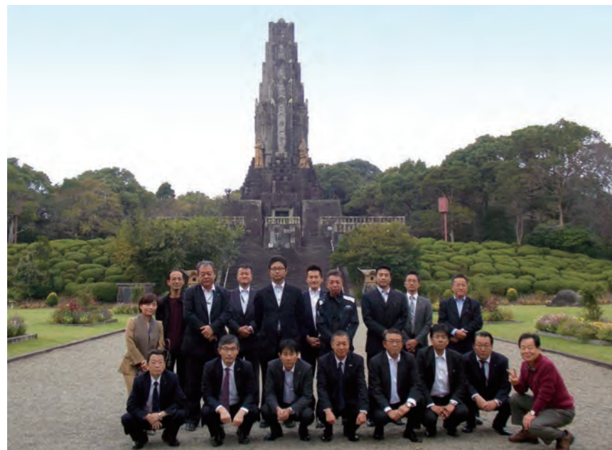
▲平和の塔を背に。塔の前にある石盤の上で手を叩くと、塔に反響して「ピーン」と音が鳴る。

社伝によると、神武天皇の孫にあたる健甕龍命(たけいわたつのみこと)(熊本・阿蘇神社ご祭神)が九州の長官に就任した際、祖父のご遺徳をたたえるために鎮祭したのが始まりと伝えられる。