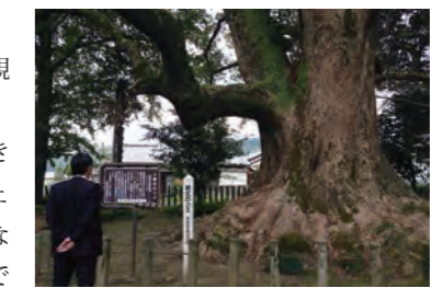
▲カメラに収めきれないほどの大クス。

軽い気持ちで歩み入ったそこは、「南方神社(みなみかたじんじや)」の敷地内でした。境内入口には国指定の天然記念物、推定樹齢約1,000年の「穂北のクス」が大きく根を張り、その生命力を誇示しています。神聖なる大樹のパワーをいただき、うれしい+αの観光となりました。