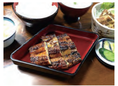
▲備長炭で丁寧に焼かれた照り照りの蒲焼!

歴史を感じる2階のお座敷で、ボリュームたっぷりのうなぎ三昧を心ゆくまで堪能しました。