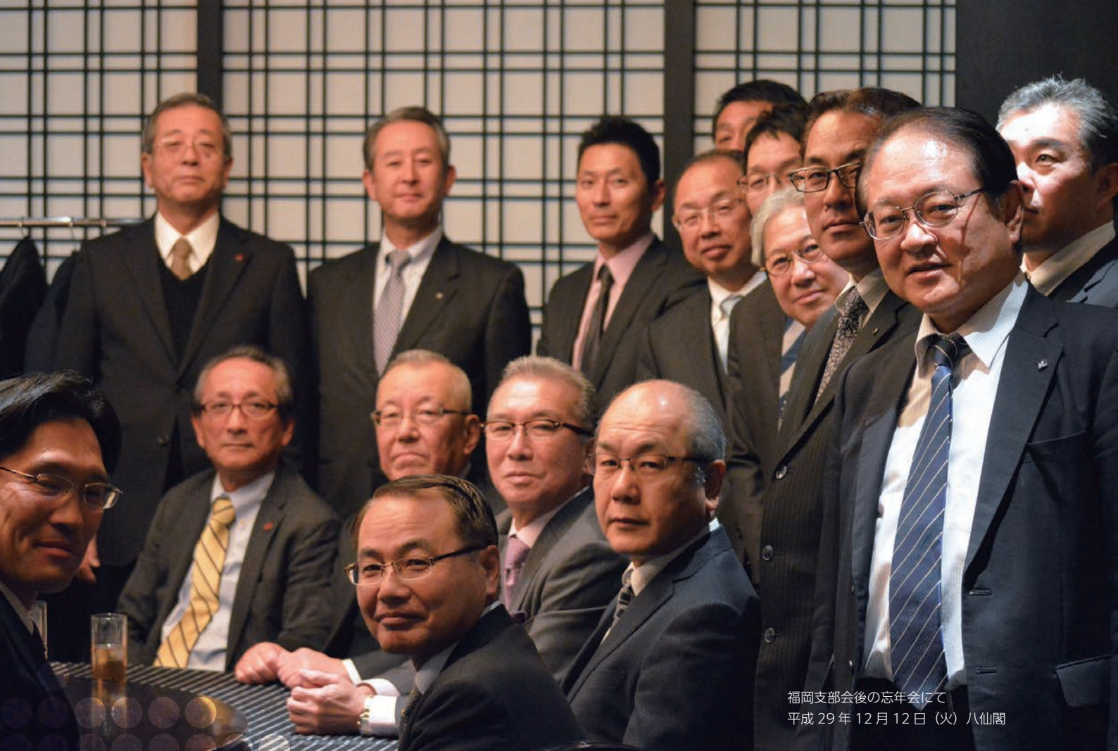
福岡支部会後の忘年会にて 平成 29 年 12 月 12 日 (火) 八仙閣