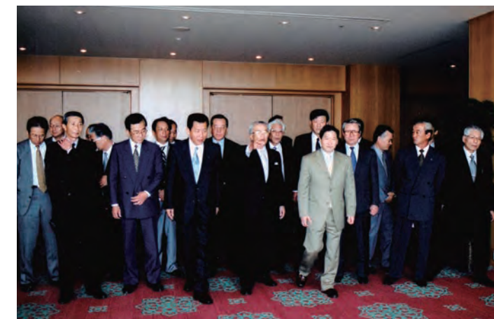
福岡電設資材卸業協同組合 創立 10 周年記念式典にて

事務局 研修ゴルフ会は、他県から赴任されたメーカーさまが仰天するほど、盛大だとお聞きしました。