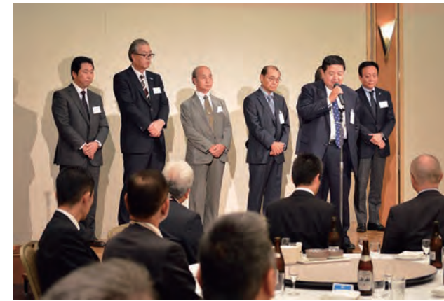
熊本支部組合員の皆さまにもご登壇いただきました。早い時期から今日の開催に向けてご準備をいただきありがとうございました。

皆さまのごあいさつをいただき、ようやくの乾杯で喉を潤し、その後は各々気持ちよくお食事と歓談を楽しまれ、復興支援へ向かう下地を固められたようです。