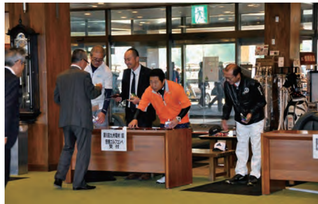
昨日に引き続き、熊本支部組合員の皆さまにご協力をいただき、スムーズに進行することができました。

「熊本地震でコースもグリーンも傾いたまばい」という御仁もいらっしゃいましたが、全体的に微妙なアンジュレーションと池が施され、かなり歯ごたえの