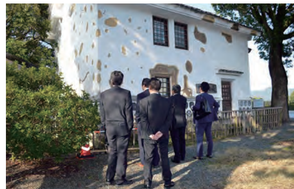
土蔵造りの「弾痕の家」。無数の弾痕が激しい戦いを物語っています。

明治 10 (1877) 年、日本最大にして最後の内戦「西南の役」の激戦地。官軍と薩軍との攻防は、17 昼夜におよび、1 日当たり 32 万発の銃弾が使われ、戦死者は両軍合わせて約 14,000 余名にのぼりました。点在する両軍の基地などには、その激しい戦いの跡が見られます。今年の NHK 大河ドラマが「西郷どん」ということで、資料館のガイドさんの説明にも熱が入っていました。